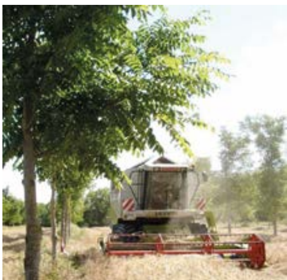
➤ Noyer élagué à Restinclières (Hérault)

La gestion de la bande enherbée limite la concurrence et permet éventuellement d'envisager une diversification de revenu.