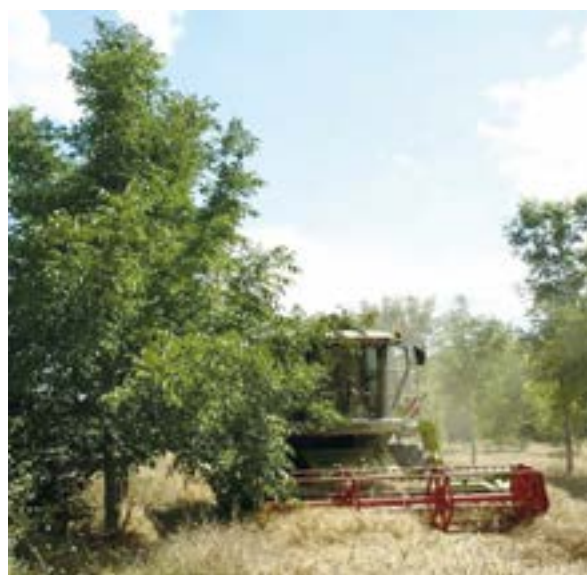
➤ Noyer jamais élagué à Restinclières (Hérault)