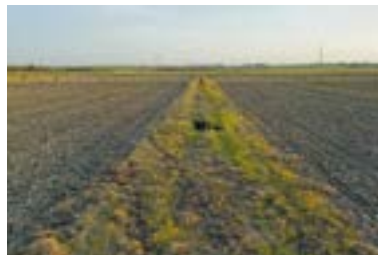
➤ Entretien chimique à éviter