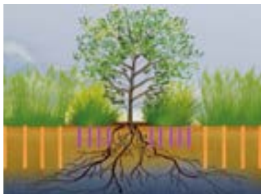
➤ Limiter la concurrence