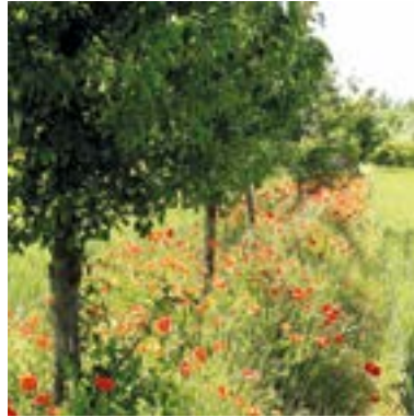
➤ Couvert spontané