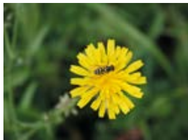
➤ Maintenir la biodiversité