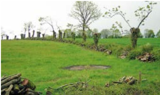
➤ Récolte des houppiers après deux ans