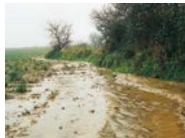
➤ Limiter les phénomènes d'érosion