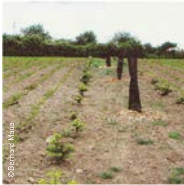
➤ Ligne productive Exemple de sapins de Noël