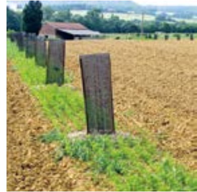
➤ Couvert semé Exemple de semis de légumineuses