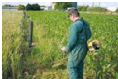
➤ Fauchage : ± 30 min / 100m