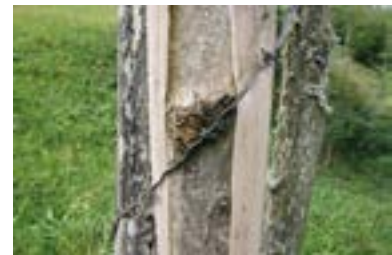
➤ Protection oubliée commençant à blesser l'arbre